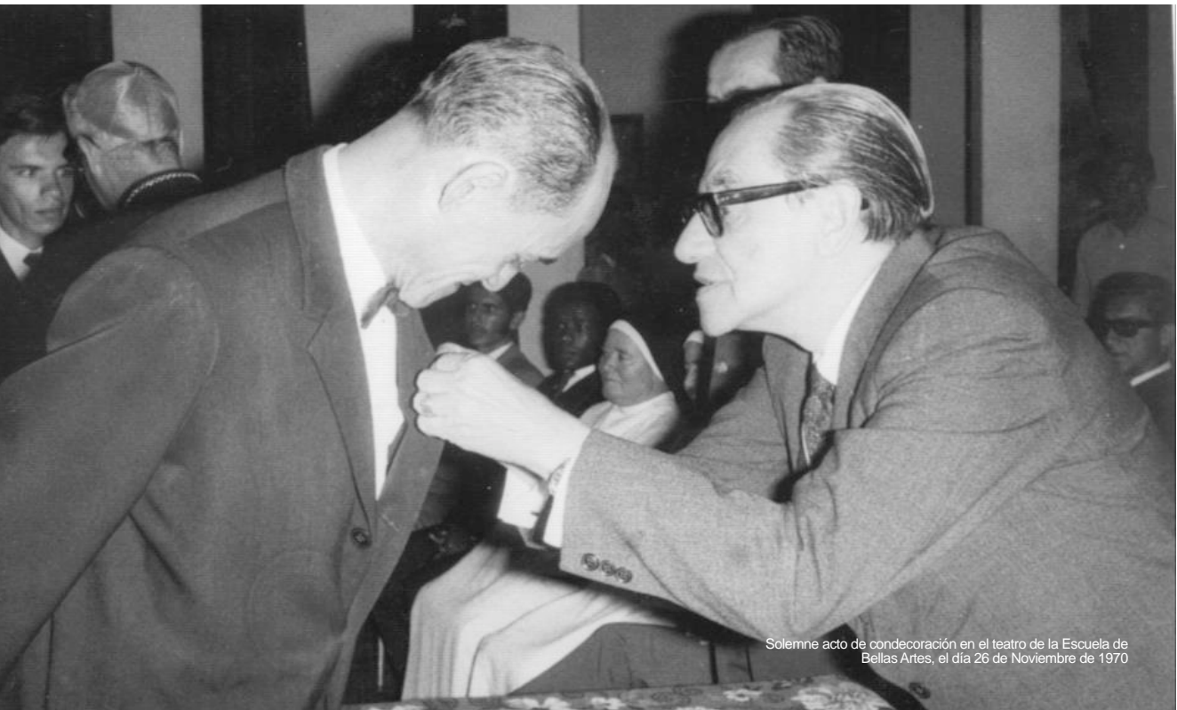
Solemne acto de condecoración en el teatro de la Escuela de Bellas Artes, el día 26 de Noviembre de 1970

Entre sus magistrales composiciones esta el bambuco instrumental “Bucareña”, ganador del primer premio del concurso de Compositores nacionales con motivo de la Feria - Exposición Agropecuaria de Bucaramanga en 1959, el Pasillo “Ansias en el alma” con letra del poeta ocañero Jorge Pacheco Quintero, ganador del segundo premio en el concurso nacional de la Reforma Agraria organizado por el Ministerio de Agricultura.